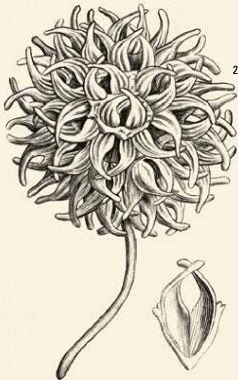
Fruit du liquidambar ( Liquidambar orientalis )

Gaertner Joseph : De Fructibus et seminibus plantarum , 1788-1804