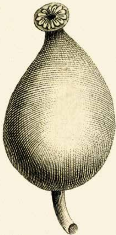
Capsule du nénuphar jaune ( Nuphar lutea )