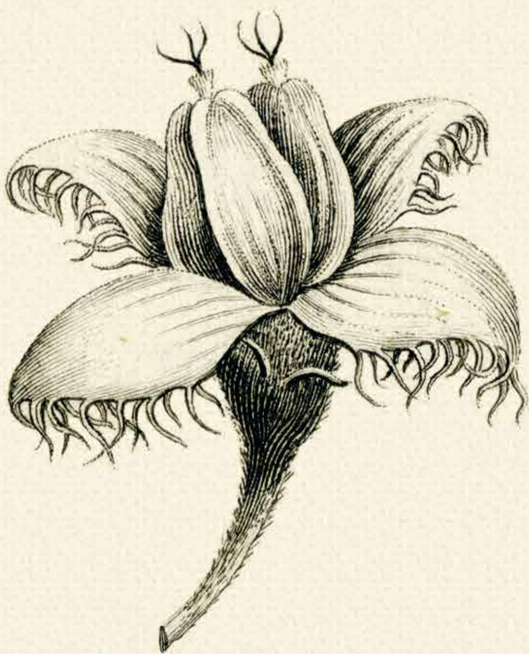
Faîne du hêtre ( Fagus sylvatica )